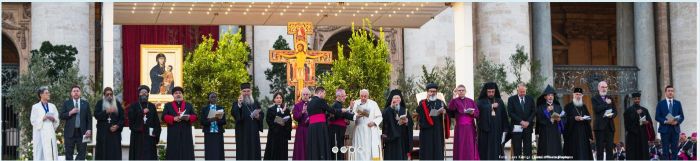
De zegen van alle kerkelijke leiders samen

Een oecumenische viering dus op het Sint Pietersplein op zaterdag 30 september die het begin inluidde van de synode. Met jongeren van over de hele wereld (op Ramon en Maartje lees je reisverslagen van twee Nederlandse jongeren) en met 20 leiders van christelijke kerken was het een heel bijzondere samenkomst waarbij de christelijke leiders allen bijdroegen aan de viering en een gezamenlijke zegen uitspraken. Een samenvatting van deze viering kun je vinden op NPOstart . De volledige viering is te vinden op het YouTube-kanaal van het Vaticaan (helaas zonder ondertiteling 😊)